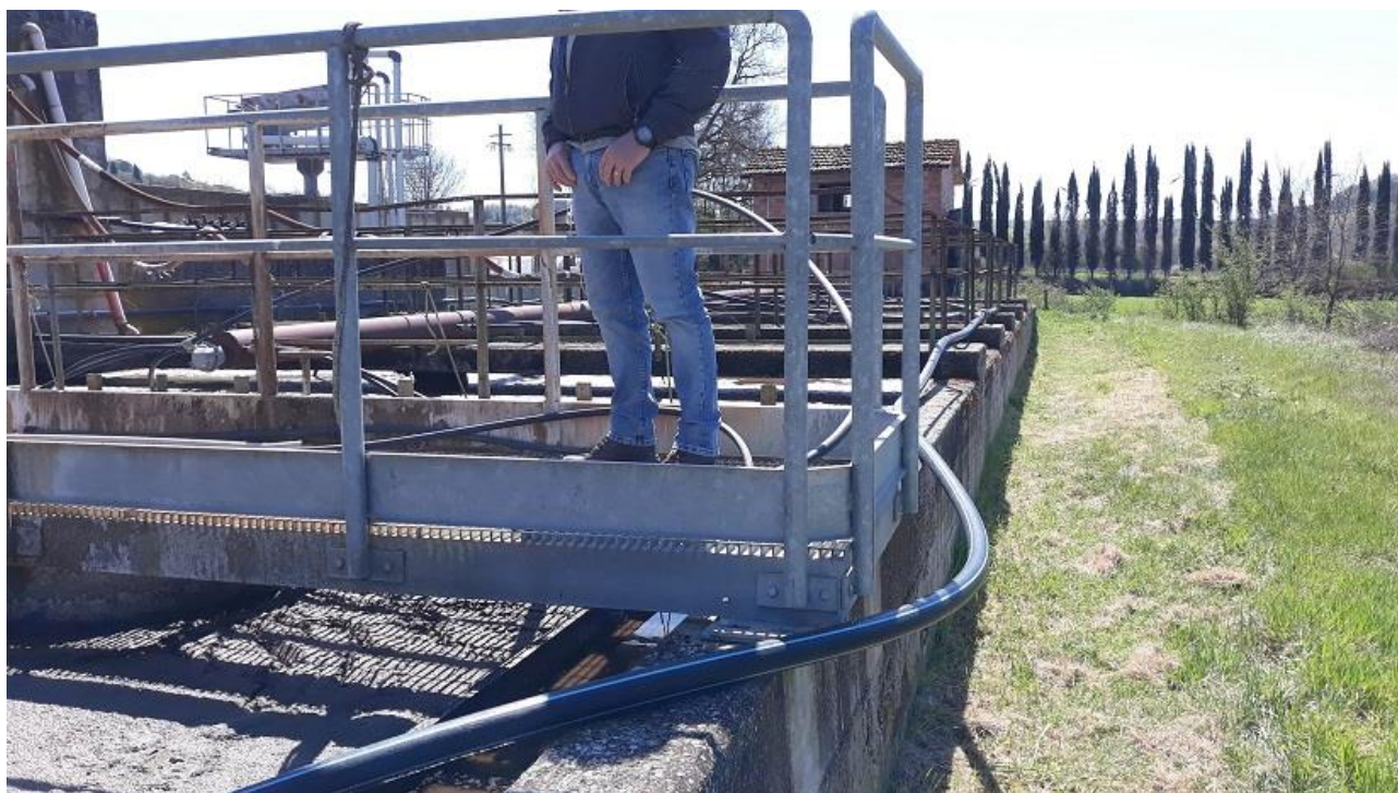
Figura 8 - Vista da nord della vasca di ossidazione esistente