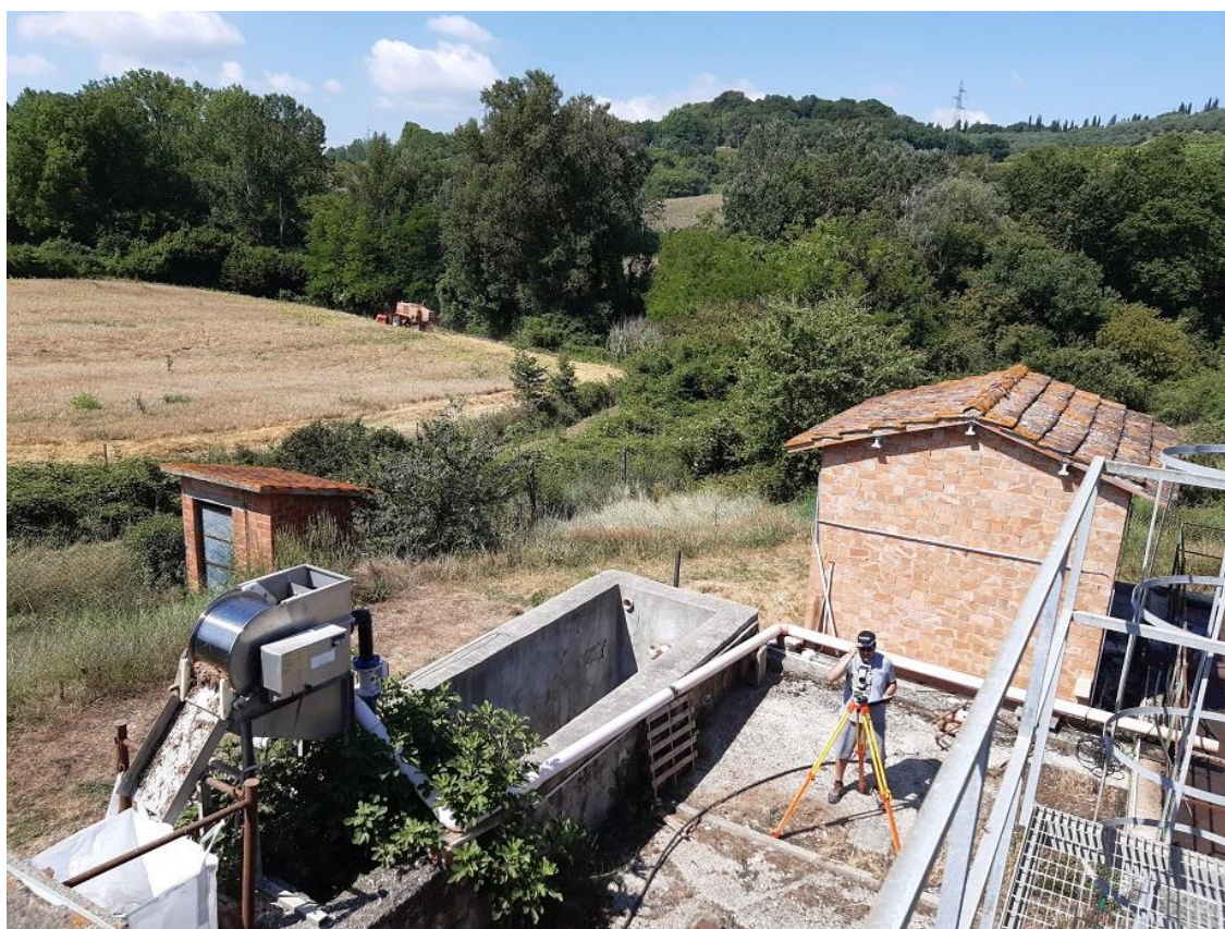
Figura 6 - Vista da Est sui pretrattamenti attuali