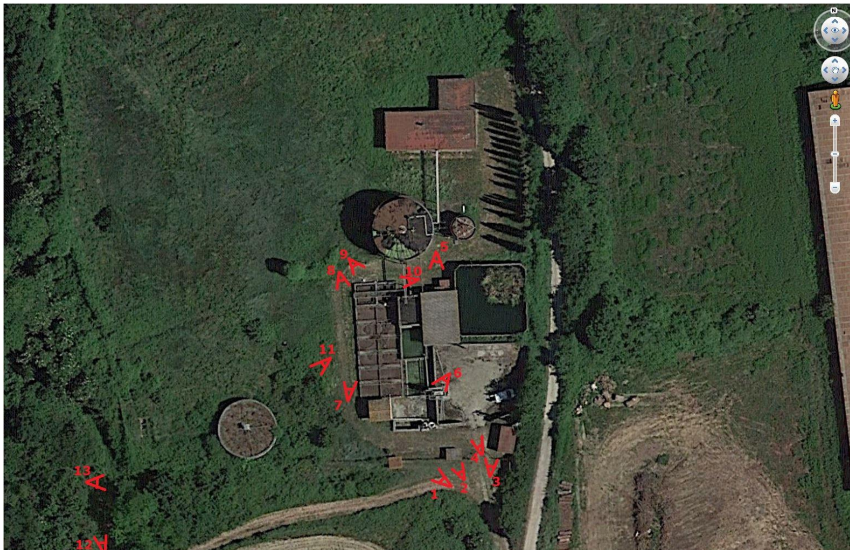
Inquadratura foto area impianto di depurazione