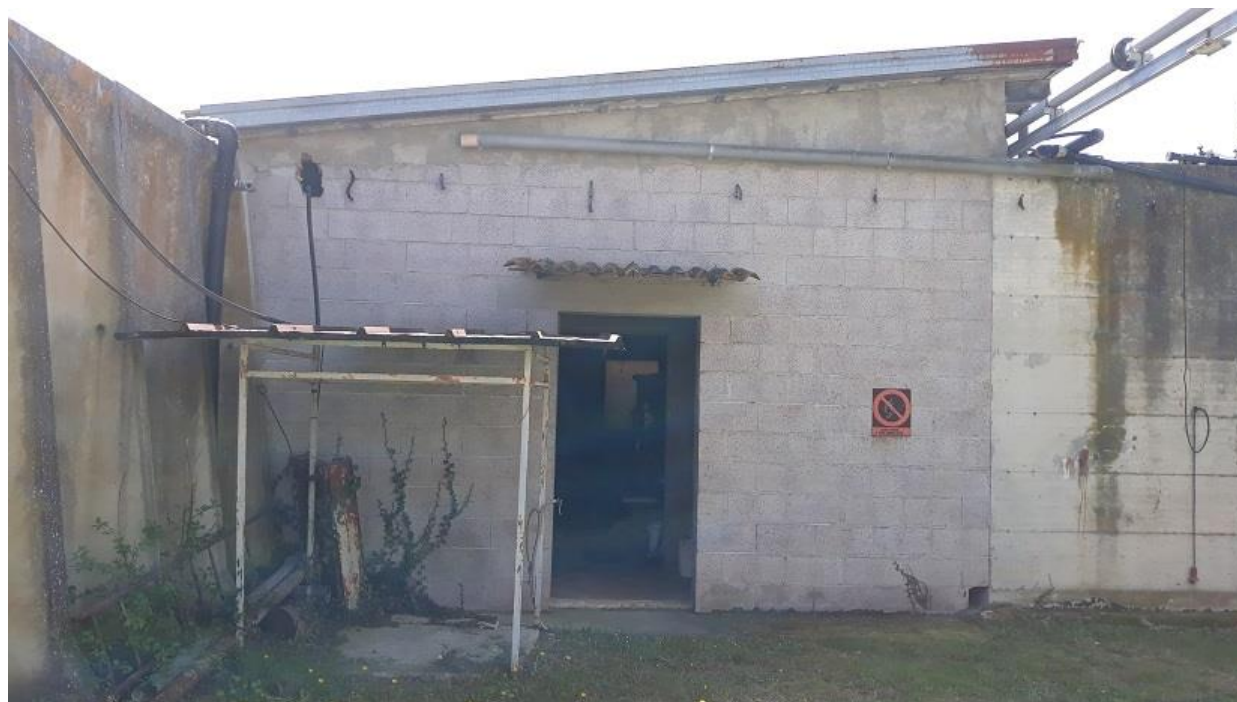
Figura 5 - Vista da Nord del fabbricato ex nastropresse da demolire