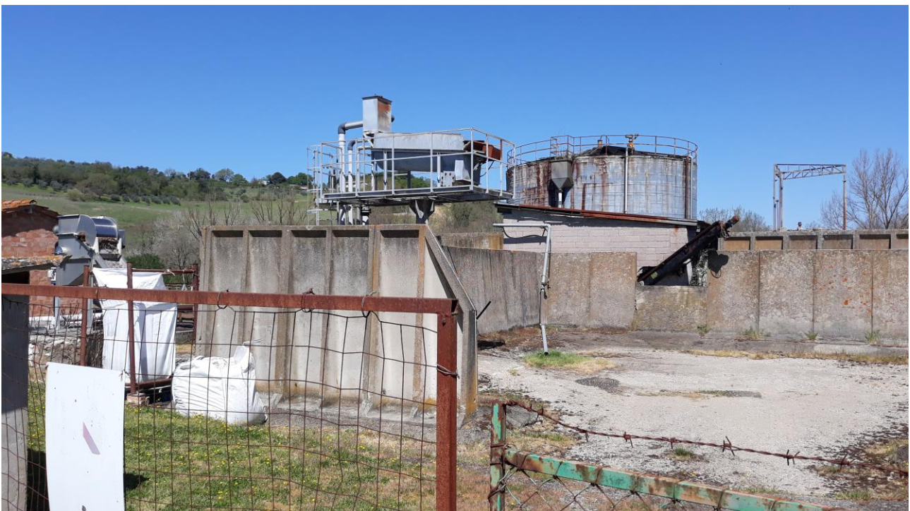
Figura 4 - Vista da sud-est del muro e della struttura metallica da demolire