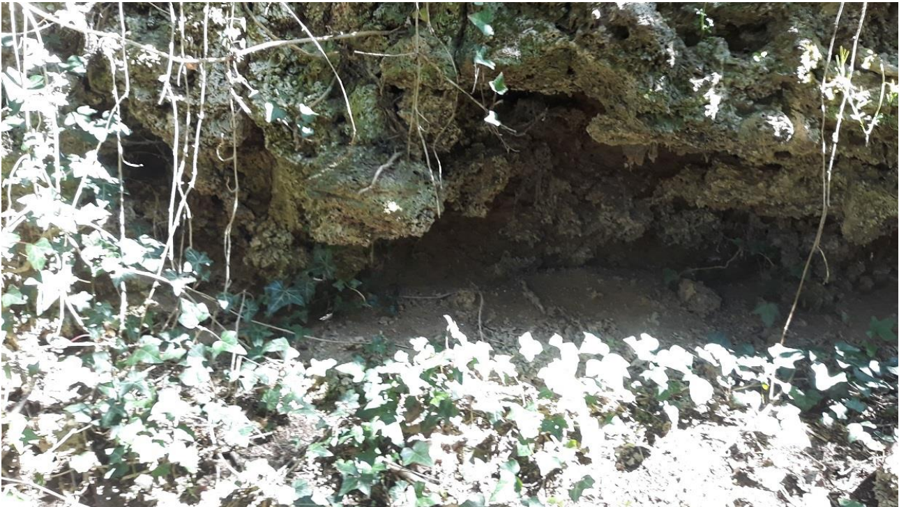
Figura 13 - Vista del piede della parete con instabilit