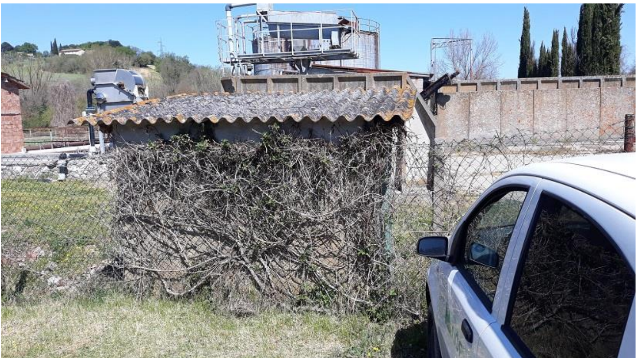
Figura 2 - Vista del locale magazzino da demolire