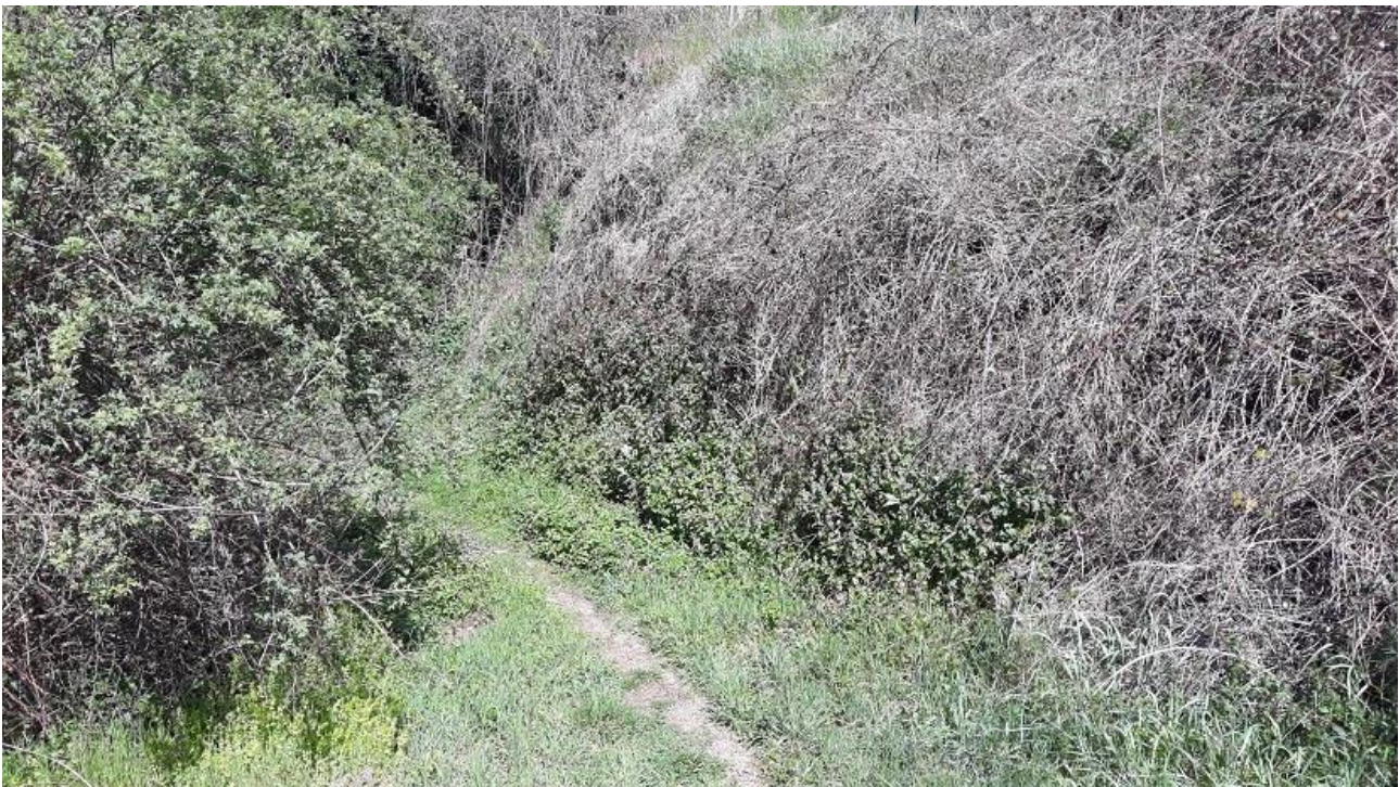
Figura 12 - Vista del viale di accesso allo scarico al fosso