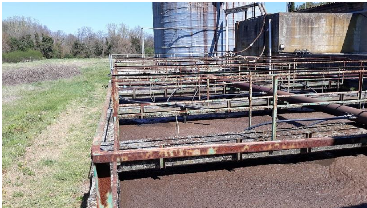
Figura 7 - Vista da sud della vasca di ossidazione esistente