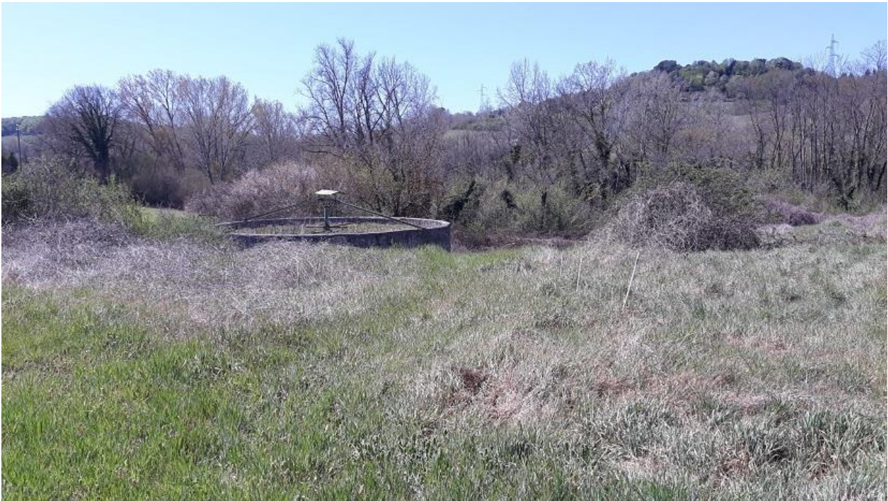
Figura 11 - Vista da Est del versante lato fosso