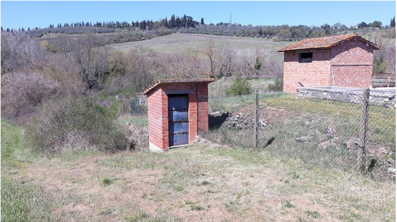
Figura 1 - Vista da sud-est sul pozzetto di arrivo e recinzione esterna