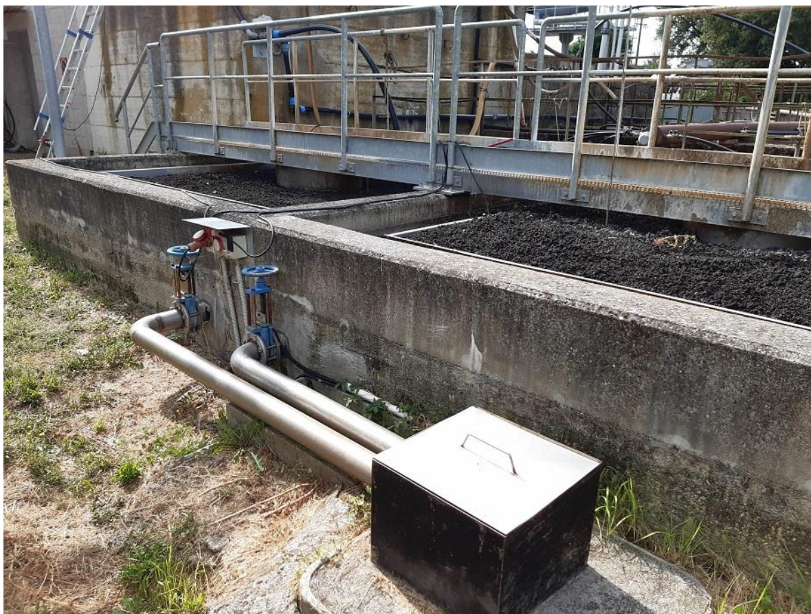
Figura 9 - Vista da Nord del pozzetto di campionamento e dei sedimentatori statici