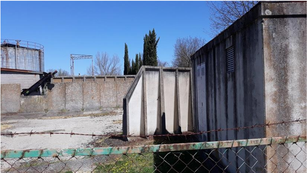
Figura 3 - Vista da sud del muro da demolire